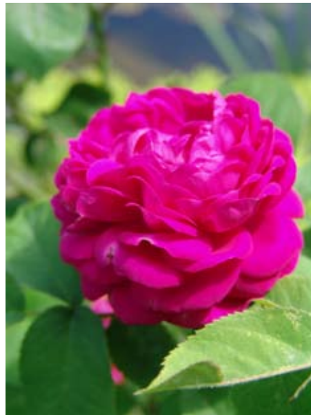
Damascener Rosen an unserem Gartenteich

res Gartenteichs – direkt neben dem großen Strauch prächtiger Damascenarosen... und schlummerte ein.